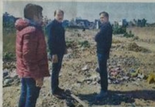
लेवी रोड के पास खाली प्लॉटों का दौरा करते कमिश्नर व बांध अधिकारी।

नोटिस भेजने के पीछे निगम अधिकारियों का तर्क है कि खाली पड़े प्लाटों खासकर वह जिनमें चारदीवारी नहीं है, उनमें आसपास