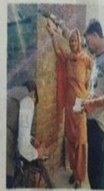
डेयरी संचालकों का चालान काटते टीम।