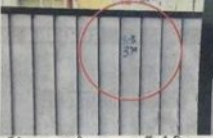
सड़क के बाहर रहने की 60 हजार प्रापर्टी हुई रिजल्ट

आगे क्या-क्या चुड़े 17 वार्डों पर भी 1 अरब से लम्बा होगा प्रापर्टी टैक्स व वाटर-सीवरेज बिल