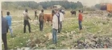
शहर के अंदर से लाए गए गायों के डेयरियाँ पर नियंत्रण लागू करने का निगम का प्रयास

शहर में चल रही डेयरियों को निगम नियंत्रित करना नया ही है। निगम कमिश्नर ने इन डेयरियों को हटाने की कार्रवाई शुरू कर दी है। निगम को यह पता चला कि शहर के अंदर से शहर में लाए गए गायों के डेयरियाँ काफी संख्या में हैं। निगम को पता चला कि इन डेयरियों पर कोई नियंत्रण नहीं है। निगम को पता चला कि इन डेयरियों पर कोई नियंत्रण नहीं है। निगम को पता चला कि इन डेयरियों पर कोई नियंत्रण नहीं है।