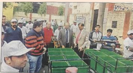
पठानकोट के स्वीमिंग पूल कॉलेक्स हॉल में स्वच्छ भारत मिशन के तहत मेयर व कमिश्नर सफाई कर्मियों को कूड़ा उठाने के लिए साइकिल वितरित करते हुए।